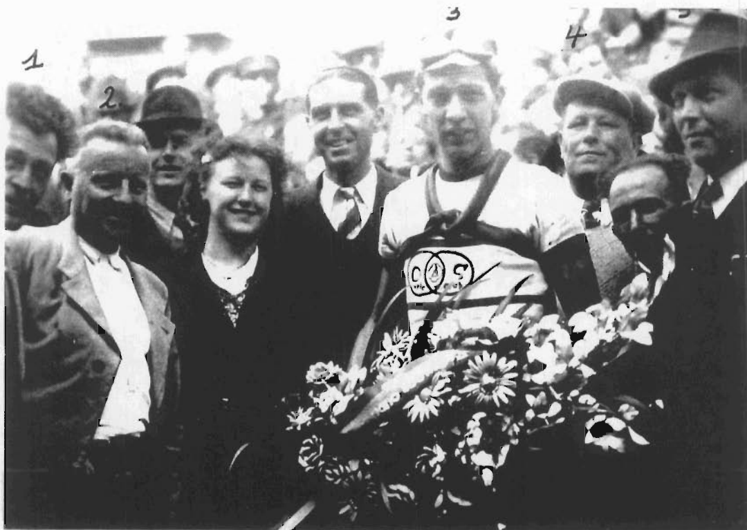
Omloop van Oudenburg 1946