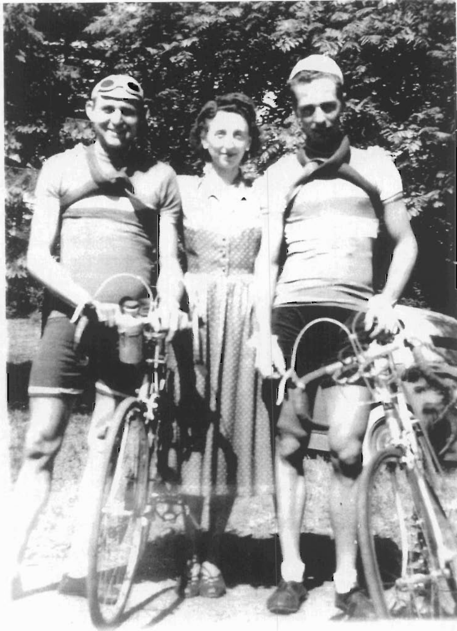
Vóór de start te Zomergem 1945