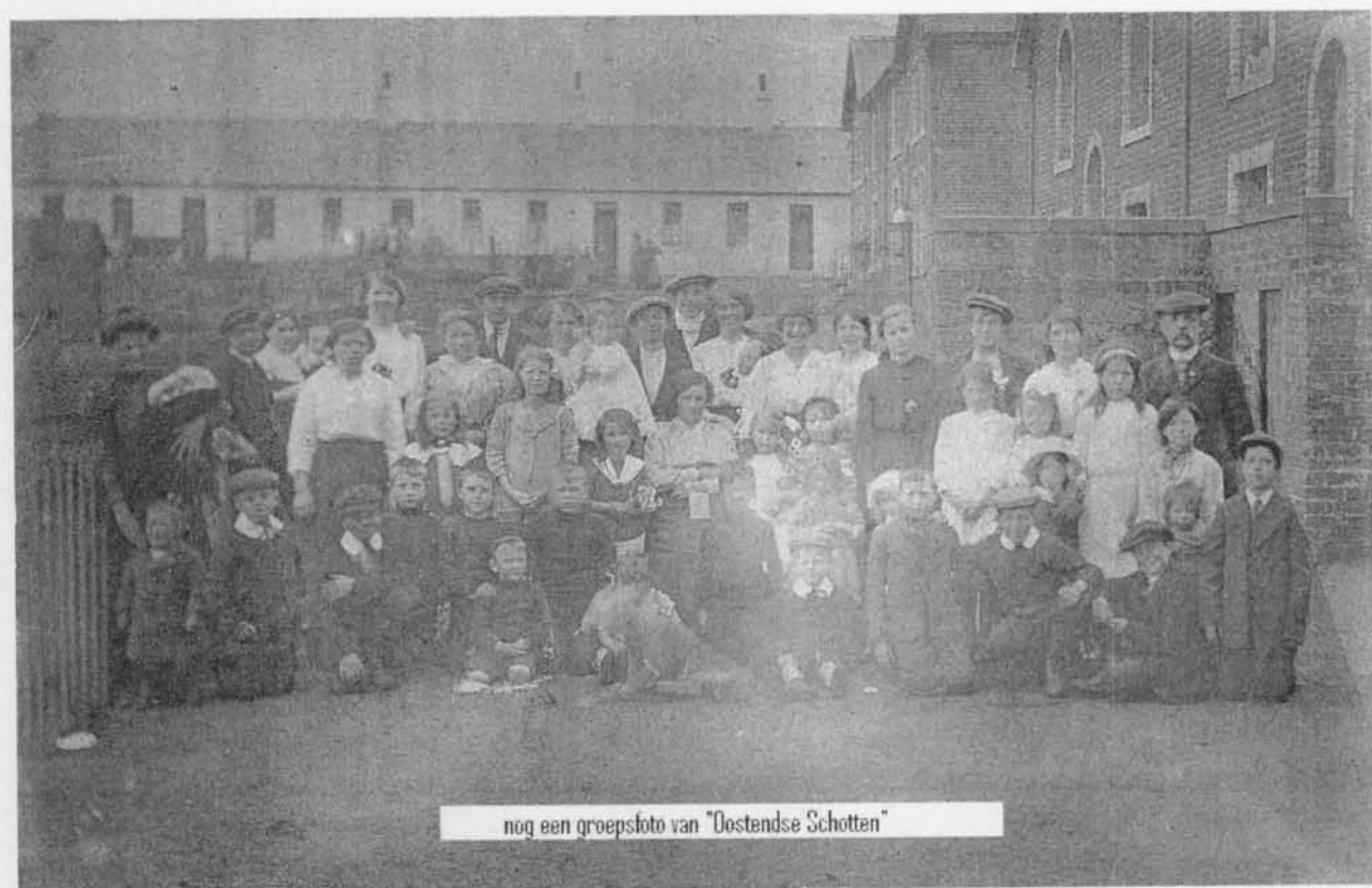
noq een groepsfoto van "Oostendse Schotten"