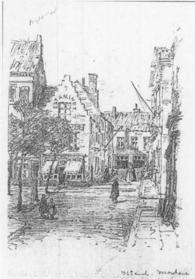
De Groentemarkt en gezicht in de Dwarsstraat

Te verkrijgen aan de balie van het Oostends Historisch Museum vanaf 15 oktober. Eventuele portkosten bedragen € 2.