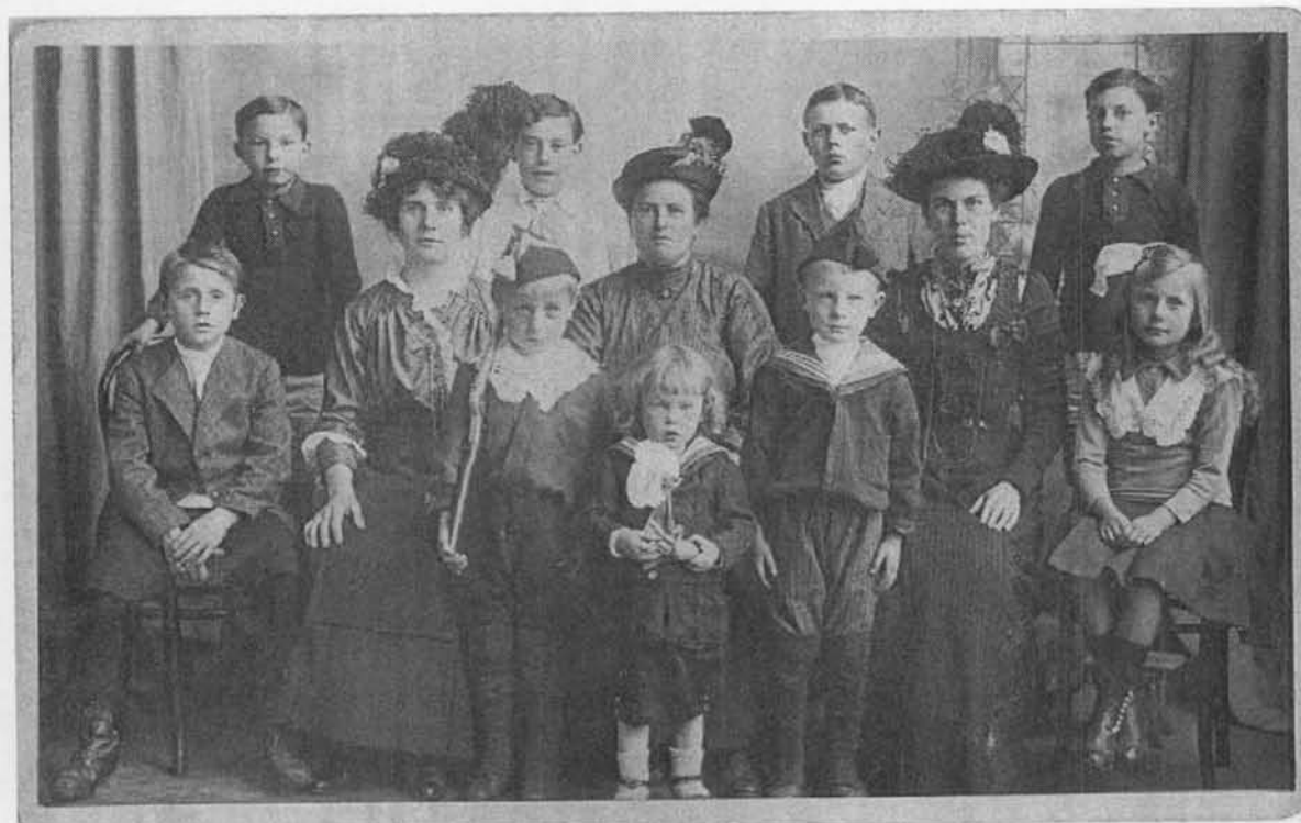
familiefoto Oostends gezin in Glasgow