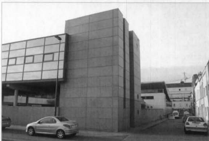
Foto 1 van fotograaf Luc toont ons het Hazegras, met vooraan de Slachthuis-kaai, rechts de Vooruitgangstraat en op de achtergrond de ondertussen afgebroken Kerk Onze-Lieve-Vrouw-Onbevleete-Ontvangenis in de Graaf de Smet de Naeyerlaan. Het markant gebouw op de voorgrond is het oude slachthuis uit 1862, dat vervangen werd in de jaren 50 door een nieuw slachthuis (Foto 2). Deze werd ingehuldigd op 14 september 1956, maar ondertussen ook reeds vervangen door het postsorteercentrum (zie foto 3; situatie vandaag, met een identiek zicht als de eerste foto).

Met deze rubriek tonen we terug interessant fotomateriaal uit ons archief.