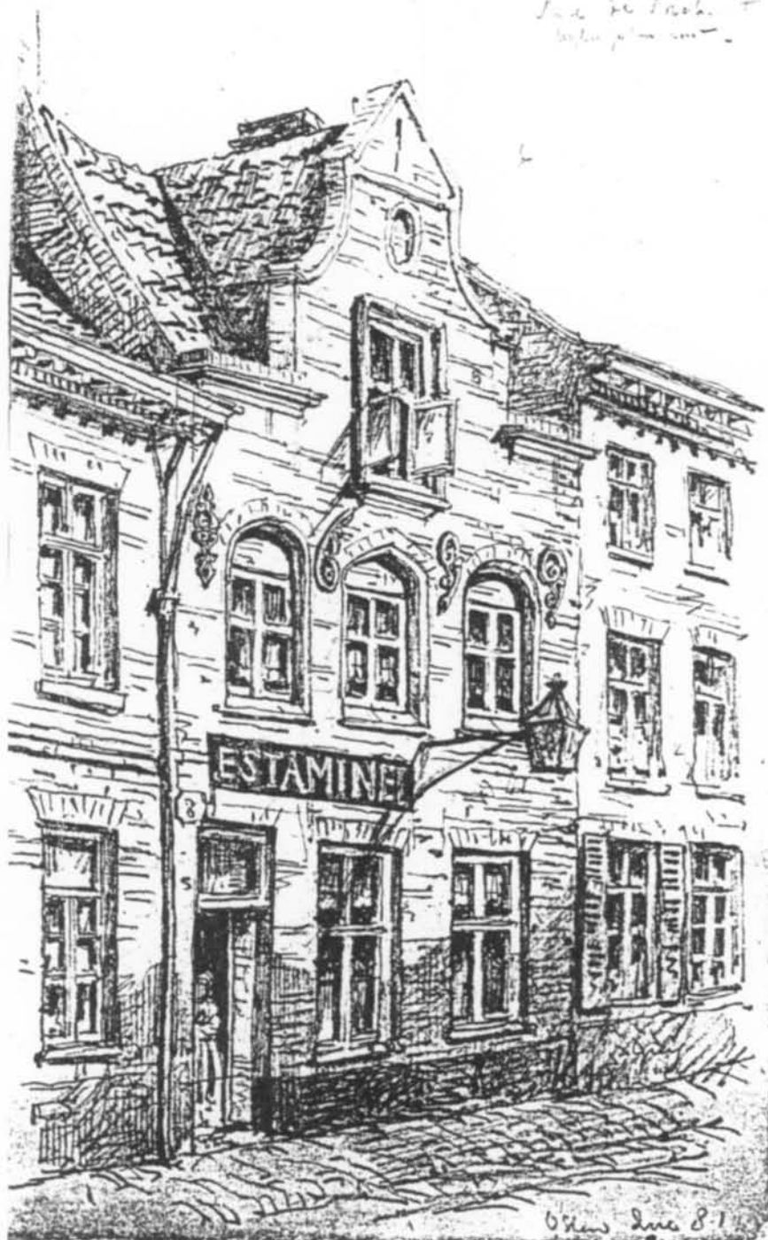
Estaminet "Het Zeepaard" in de Brabantstraat nr. 8 (gedateerd June 1881)