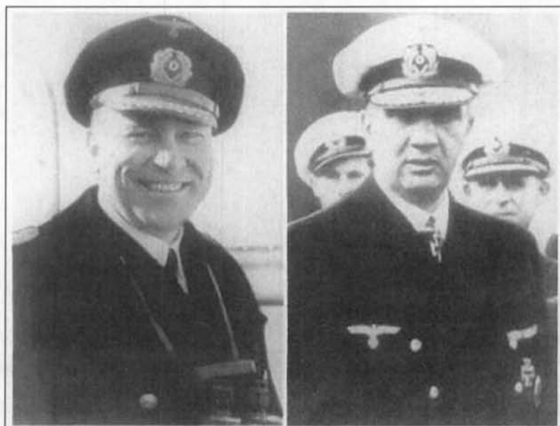
Kapitän-zur-See Fritz Hintze kapitein van de Scharnhorst

De Scharnhorst wordt afgemaakt. Om 19.28u staakt de Duke of York het vuur nadat ze op Scharnhorst haar 80° salvo afvuurde waarbij ze in het totaal 446 granaten verbruikte.