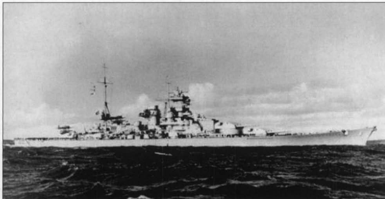
De Scharnhorst .

Om 16.47u beveelt admiraal Fraser de Belfast lichtgranaten af te vuren. Daarna vuurt hij van op een afstand van 11 km een eerste breedzijsalvo af met zijn tien 35.6 cm. kanonnen en lukt treffers. Jamaica bindt eveneens de strijd aan. De Scharnhorst vervolgt echter haar koers en vuurt regelmatig terug waarbij zij met haar zwaarste 28 cm. geschut, draagwijdte 40km930m, de mast van de Duke of York beschadigt. Ze zit echter klem tussen de twee eskaders van de Home Fleet .