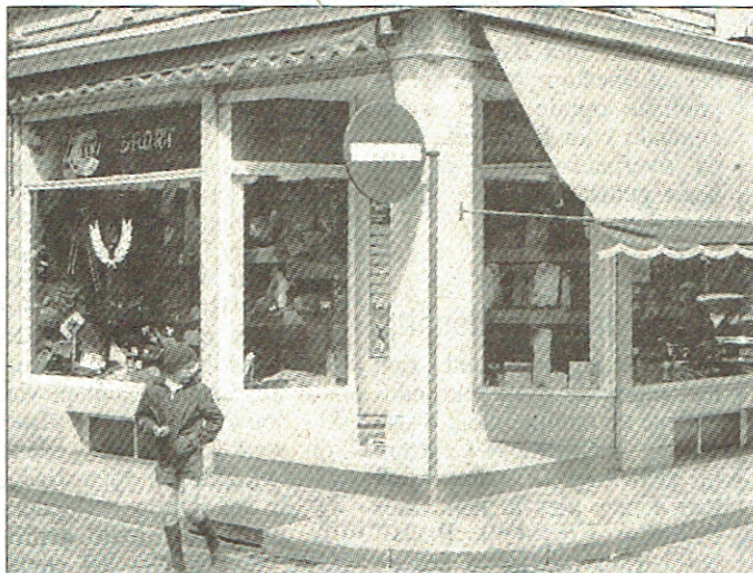
Aan het uitzicht van Huis Jacqueloot is in de loop der jaren niet zoveel veranderd. Hier een beeld anno 1970.