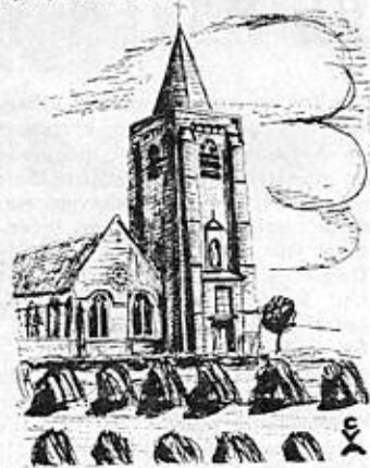
langs het trekkerspad

tige smalle baantjes van Zeeuws-Vlaanderen, eerst naar het Zwin en daarna over Knokke naar jh. De Duindoorn te Heist aan Zee. Het volgende dagtraject voert de trekker langs landelijke wegen over Oostkerke, Damme, Dudzele, Lissewege naar Wenduine, stuk voor stuk bezienswaardige plaatsjes. Van Wenduine terug landinwaarts langs Vlissegem, Stalhille, Jabbeke (met het Permeke museum!) en vandaar over Ettelgem, Oudenburg, Zandvoorde en Stene naar jh. De Branding.