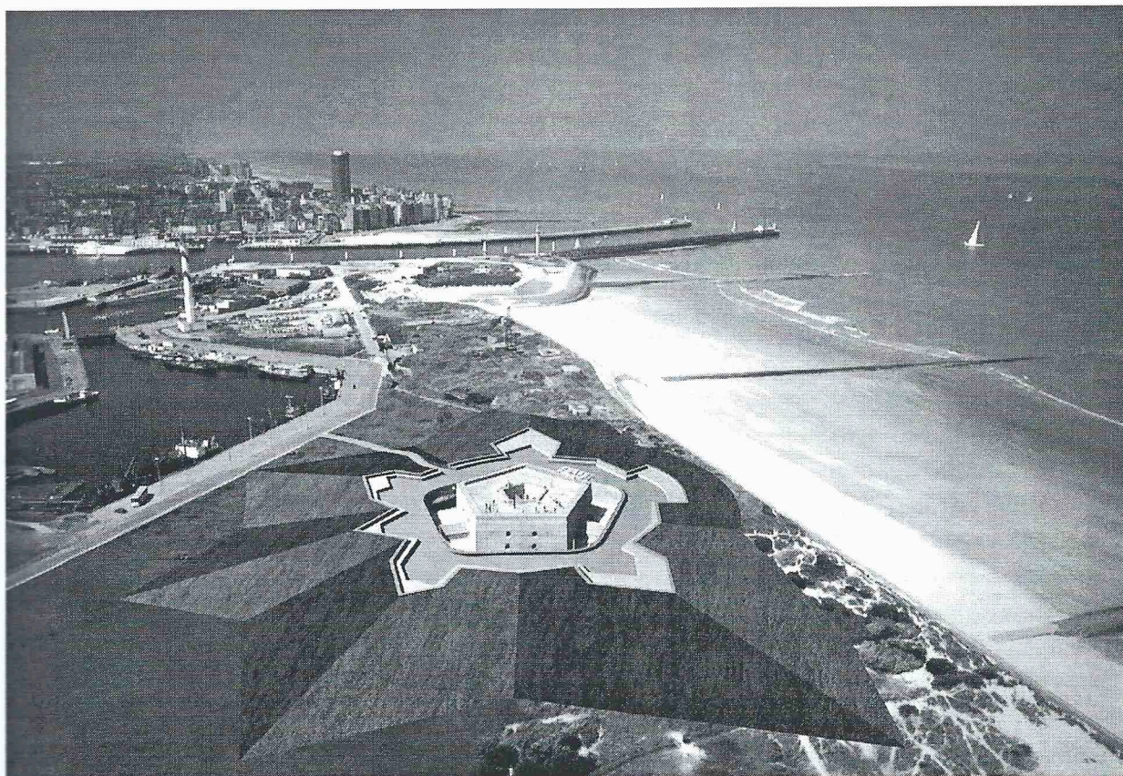
3d simulatie van de inplanting van het historische glacis in huidige context

Tot slot is deze herwaardering ook vanuit ecologisch standpunt een opportuniteit : als de storende asfaltwegen en betonnen afrasteringen worden vervangen door milieuvriendelijke alternatieven en het glacis beplant wordt met aangepaste plantensoorten, ontstaat er spontaan een natuurlijke harmonie met de omliggende duinen.