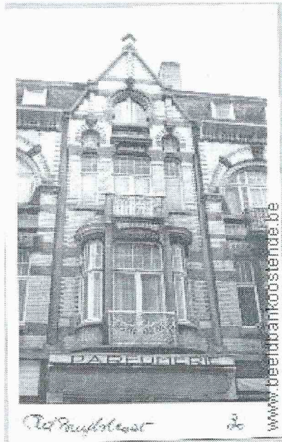
Adolf Buylstraat 30

Op het einde van de negentiende eeuw maakte de art nouveau architectuur in ons land een opgang. De bloeiperiode ervan lag tussen 1893 en 1914. Deze stijl beperkte zich veelal tot de gevel van het gebouw. Achter de gevel treffen we het geijkte negentiende eeuwse interieur aan. Huizen, waarvan ook het interieur volledig in art nouveau waren zeer dure constructies en komen in Oostende niet voor.