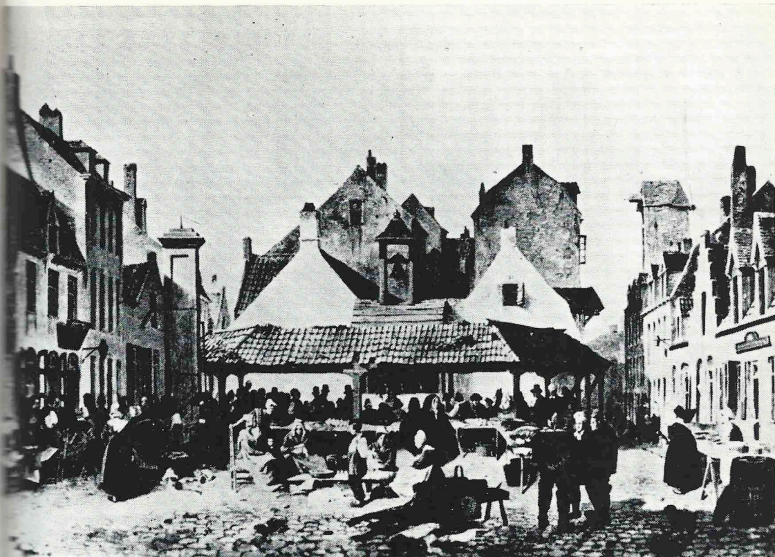
DE OUDE VISMARKT