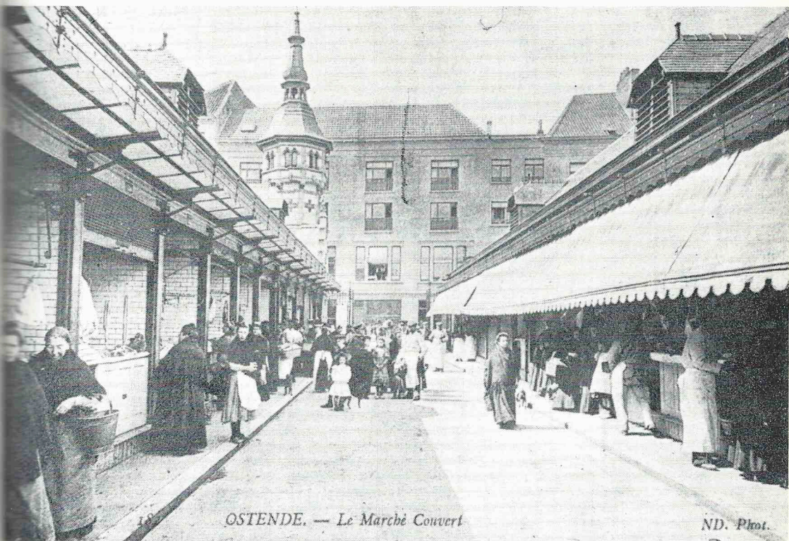
OSTENDE. — Le Marché Couvert