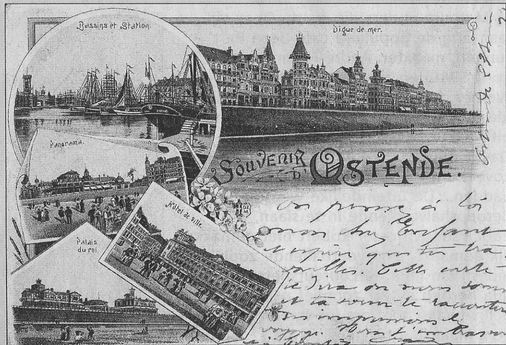
Een prentkaart verzonden in het jaar 1907.

Wie met veel interesse prentkaarten verzamelt, is nooit uitgekeken op die kleine parels die pientere uitgevers publiceerden.