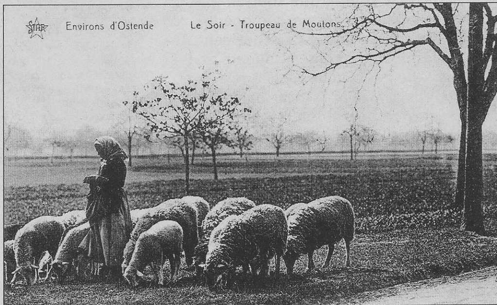
Een herderinnetje met een kudde schapen

tussen boerinnen, een ganzenhoedster... Telkens ademden de kaarten een nostalgische sfeer uit die herinnerde aan een ideaal leven in nauw contact met de natuur. En dit terwijl de meeste afzenders van de postkaarten ongetwijfeld tot