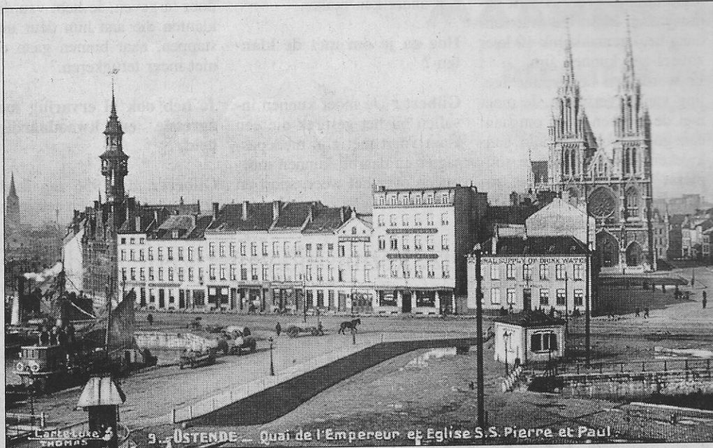
De Vindictivelaan of de Keizerskaai, zoals de laan aan het begin van de vorige eeuw heette.

■ Een eeuw geleden verscheen er in Oostende een prachtige reeks van achttien kaarten. De uitgever beperkte zich tot de summier vermelding 'Carte-Luxe Thomas', zodat we over de identiteit van de uitgever niet veel te weten komen.