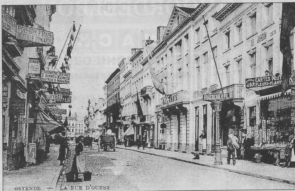
De Adolf Buylstraat met rechts het nummer 42.

Op de tweede kaart zien we het huis 42 in de Adolf Buylstraat, toen de straat nog de Weststraat heette. In de winkel werden bloemen en planten verkocht, maar er hangen ook vele postkaarten voor de winkel. Als we ons niet vergissen, verkocht de winkel ook kleine Oostendse souvenirs zoals