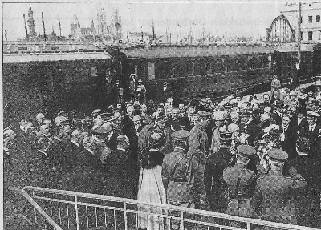
De vorsten werden opgewacht door de personaliteiten.

van de Amerikaanse regering, die een zeer grote bewondering en eerbied had voor onze vorsten, die tussen 1914 en 1918 op hun grondgebied tussen hun soldaten waren gebleven. Daarom kwamen er maar liefst vier oorlogsbodems de Belgische vorsten afhalen. De Mandax en de Hale kwamen tot voor onze kust. De Ingogram voer de haven van Oostende en vertrok nog diezelfde ochtend met de hoge gasten en hun gevolg. De George Washington tenslotte bleef buiten de Franse territoriale wateren liggen. Voor de kust van Calais zouden de vorsten overstappen om in negen dagen de overtocht naar New York te maken om dan eind oktober terug naar huis te keren.