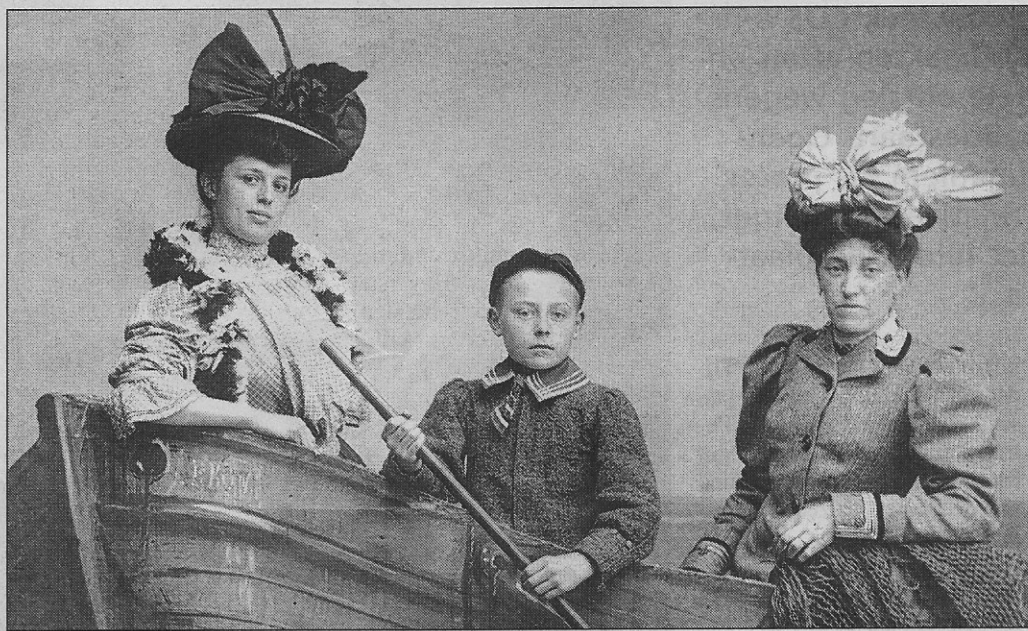
Op zijn paasbest bij fotograaf Lebon. (1910)

één of meer hoedendozen bij. Zoiets hoorde nu eenmaal bij de bagage.