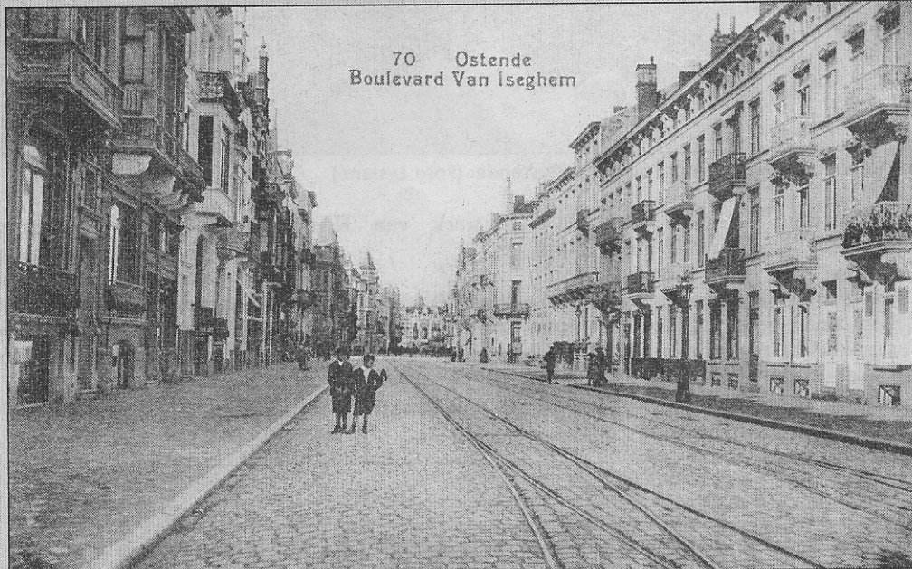
70 Oostende Boulevard Van Iseghem

Over de tramsporen hebben we hier vroeger al geschreven. Een tram hebben we op de prentkaarten nooit kunnen zien, of het was bij de inwijding van het monument van koning Leopold I. Toen stond er een voertuig bijna ter hoogte van het Leopold I-plein. Met die twee kaarten ziet men eens echt wat autoloze straten zijn. Wellicht vindt u het zelfs maar trieste beelden.