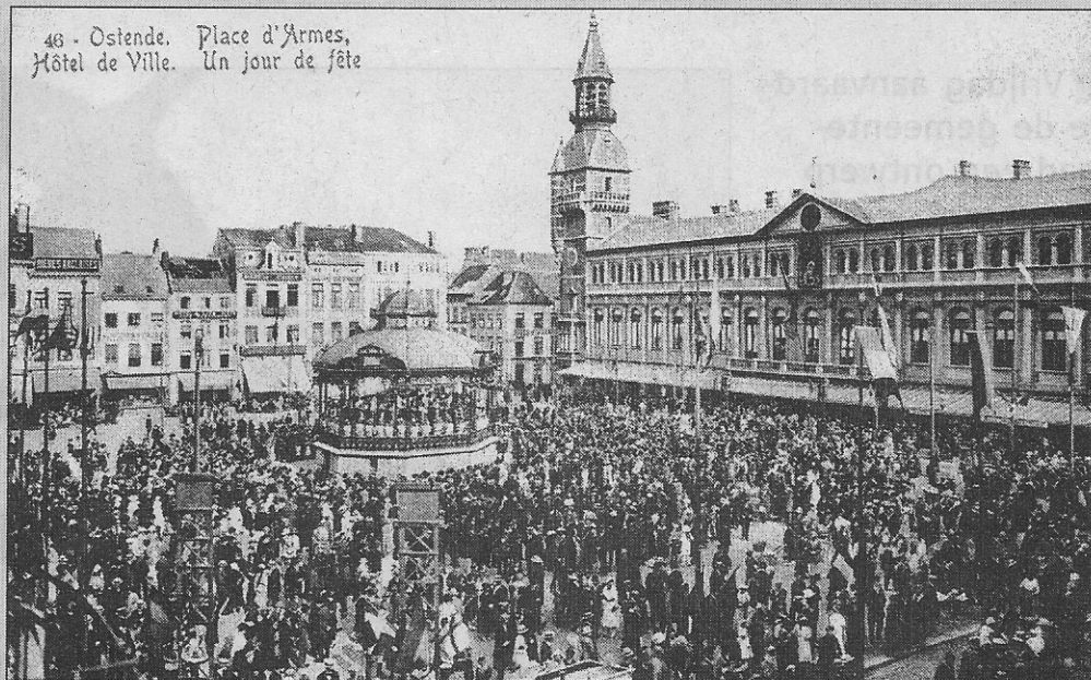
Een groot feest op het Wapenplein (1909?)

We denken hierbij aan de eerste vliegmeetings, die voor 1914 boven de zee en het strand plaatsvonden. Grote vedetten waren toen de vliegtuigpioniers Paulhan en Olieslaghers. Veel volk lokte