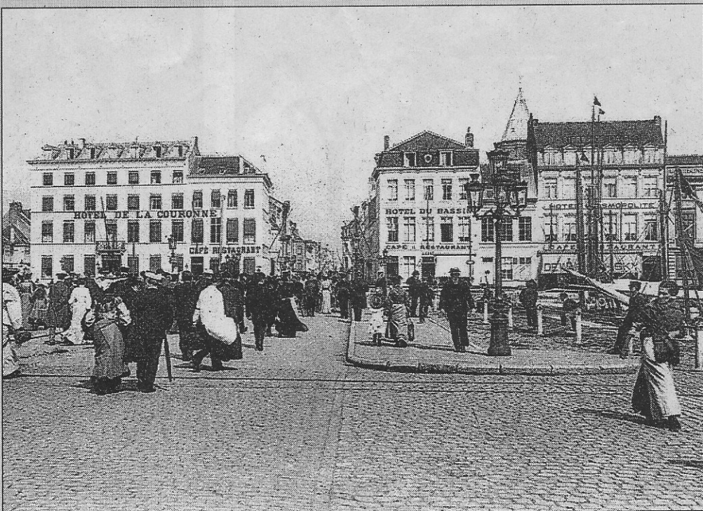
Zondagstoeristen trekken over de Kapellebrug het centrum in (1904).

Twee kaartjes uit die tijd tonen hoe de massa zondagstoeristen — de eerste uit die tijd — Oostende overweldigden. Men kan zich nu nog moeilijk voorstellen welke indruk het gaf aan die mensen, die vaak uit afgelegen dorpjes