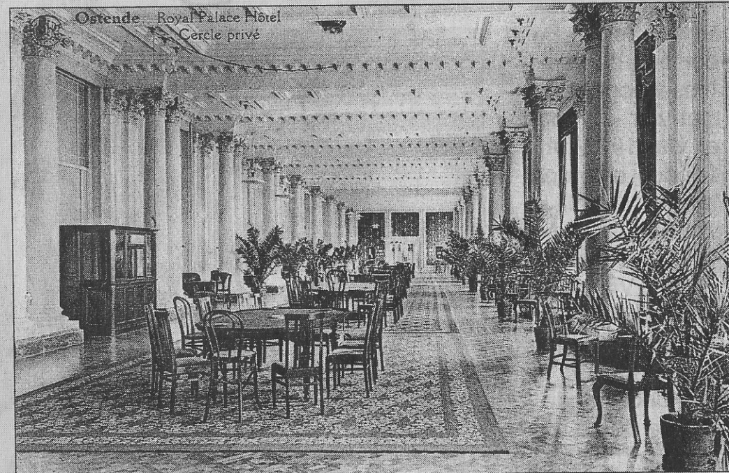
De Cercle Privé of speelzaal

Over het Royal Palace Hotel zijn er minstens 120 verschillende postkaarten in omloop. Toch blijft elke postkaart verwondering oproepen over de enorme luxe van het hotel. Misschien is het hotel nog het best te vergelijken met de overdadige luxe in de voormalige paleizen van Saddam Hoessein in Irak. Weliswaar zijn er in Irak tientallen dergelijke paleizen. Oostende had er maar een.