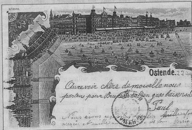
Het kursaal met de zeedijk oost en west

saal, de zeedijk en vele baders werd verstuurd naar La Haye (Den Haag) aan een jongedame. De afzender heeft laten weten dat hij terug naar Brussel vertrekt. De stempel van de post leert ons dat het al 22 augustus was en het seizoen ten einde liep. Deze sierlijke kaart met veel kleuren en gouddruk werd in Duitsland gemaakt.