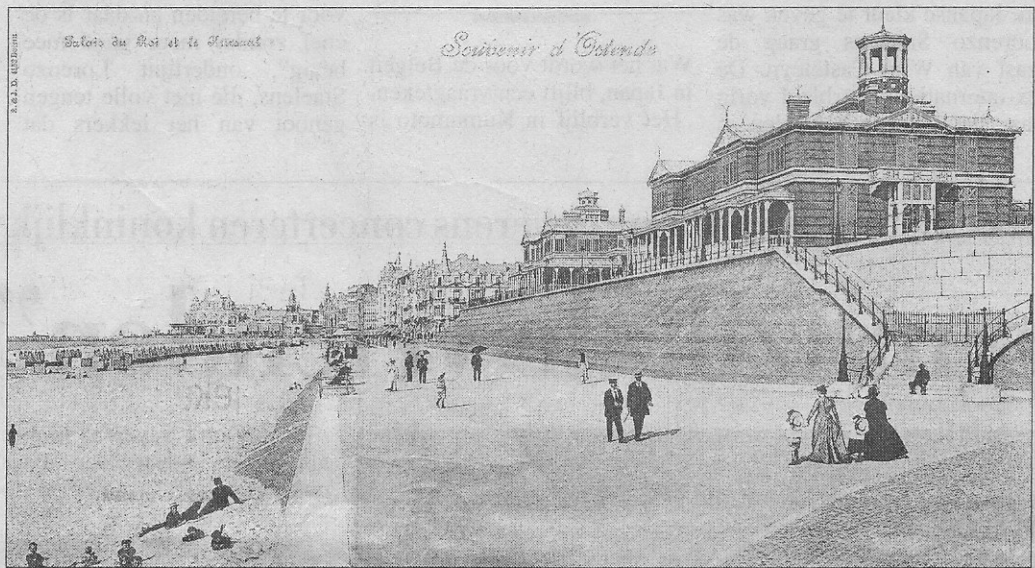
De Koninklijke Chalet, de dijk en het strand met de badkarren.

Hoeveel verschillende soorten van deze kaarten bestaan, kunnen we niet zeggen; er zijn er te veel verloren gegaan. Met wat geluk en veel zoekwerk konden we in de loop der jaren een 80-tal dergelijke prentkaarten van Oostende bijeen krijgen. Sommige zijn dubbel en zelfs drie keer zo groot als een gewone post-