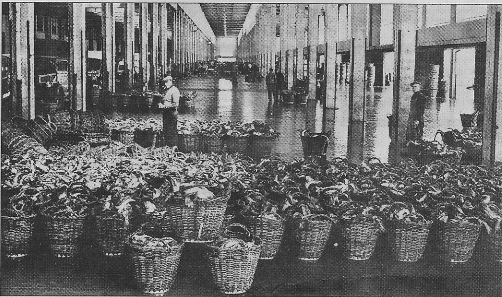
Visbennen staan te wachten in de hal van de vismijn om te worden opgeladen (1958).

Er wordt wel eens beweerd dat de oorzaak ligt bij het steeds kleiner worden aantal Oostendenaars dat in de stad woont. En dat het de fout is van de inwijkelingen. Wie kan en durft de schuldlige aanwijzen?