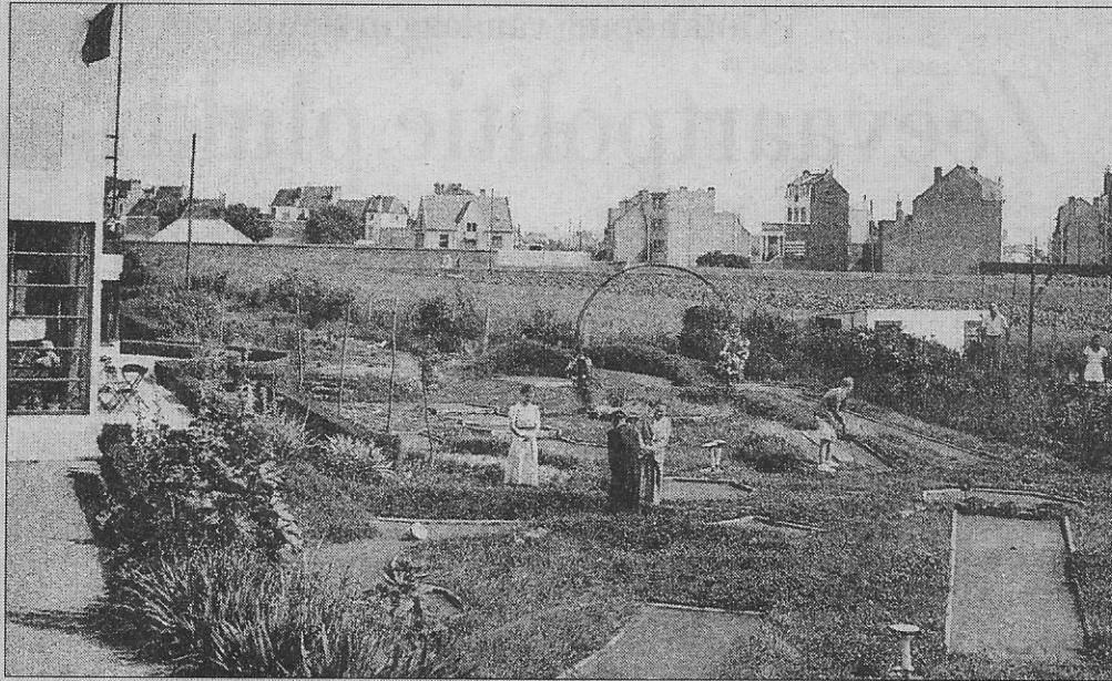
Minigolf Oswerlu op Mariakerke (circa 1939).

In de jaren dertig tot in de jaren zeventig was er een bekende minigolf op de wijk