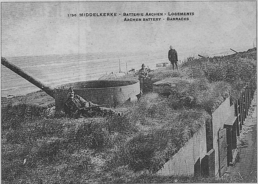
De batterij Aachen werd na de Eerste Wereldoorlog bezet door Belgische soldaten (circa 1920).