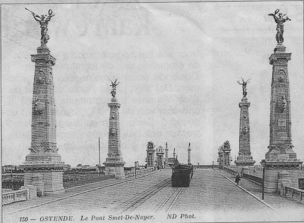
De brug voor 1914 gezien naar de haven toe.

Nabij de sluis werden zware kolommen gebouwd en ook daar tegenaan werden halfverheven beeldhouwwerken met mooie vrouwenfiguren ont-huld. De tekeningen voor het ontwerpen van die beelden kwamen van de Fransman Al-