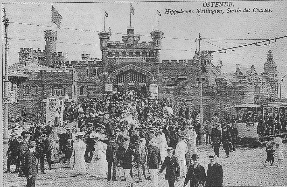
De mooie toegang tot de hippodroom. Het Wellingtonfort verdween tijdens de oorlog.

Deze Wellingtonrenbaan, waar het beeld van het beroemdste renpaard dat België ooit bezat, pronkt, heeft dus al een grote brok geschiedenis achter de rug. De Prince Rose was een paard met aanzien ; hopelijk blijft zijn beeld er nog lang — ook als symbool — staan.