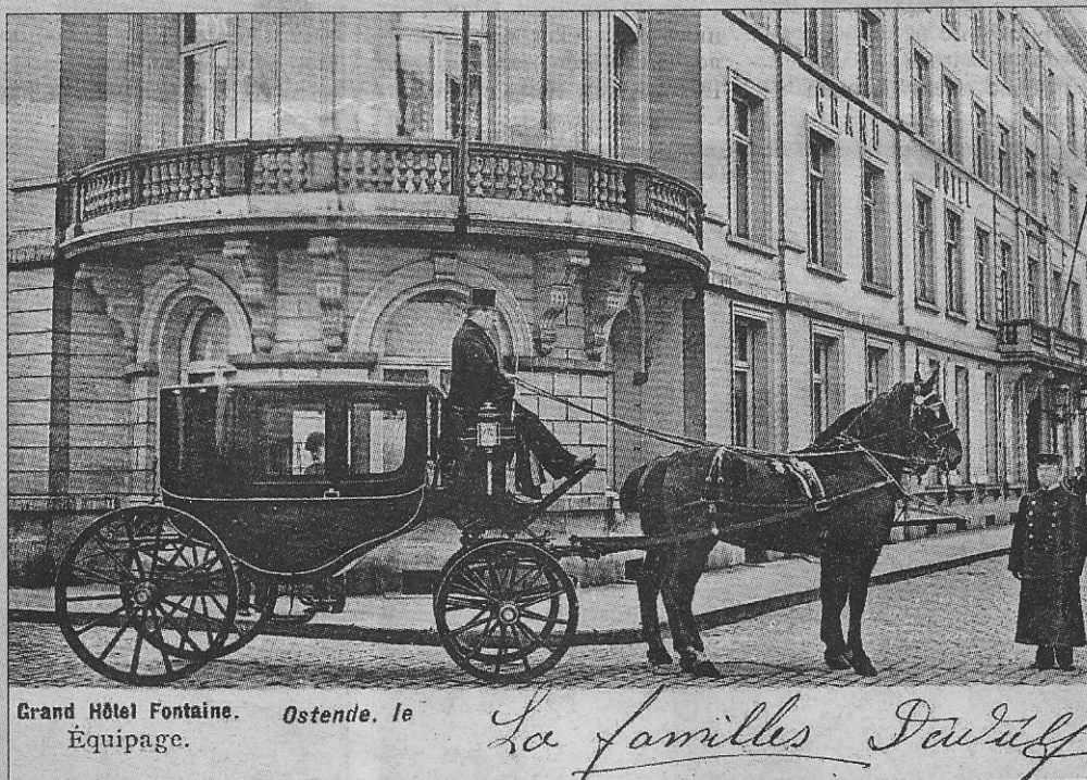
Grand Hôtel Fontaine. Ostende. 1e Equipage.

Grand Hotel Fontaine was een zeer groot hotel dat veel publiciteit maakte. Zo konden we al een zevental verschillende publiciteitskaarten van rond 1860 ontdekken. Daarop lezen we o.a. dat het hotel gelegen was nabij de nieuwe brug die naar de dijk leidde. Die brug bracht de voetgan-