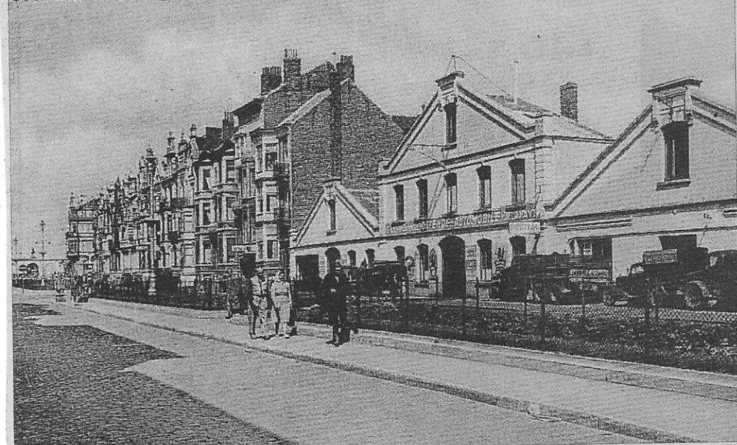
Garage Delahaye in de Koninginnelaan (circa 1938)

Witzenburg in de Sint-Petersburgstraat (nu L. Spilliaertstraat) met „Fiat”; Van Caysele, Torhoutsesteenweg 54 met „Ford” en „Citroën”; Ed. Vereycken, Capucijnenstraat 1 met „Jewett”; garage Wybo, Torhoutsesteenweg met „Minerva”, „F.N.” en „Renault” en Dever en Vandaele, Torhoutsesteenweg 21-23 met „Peugeot”.