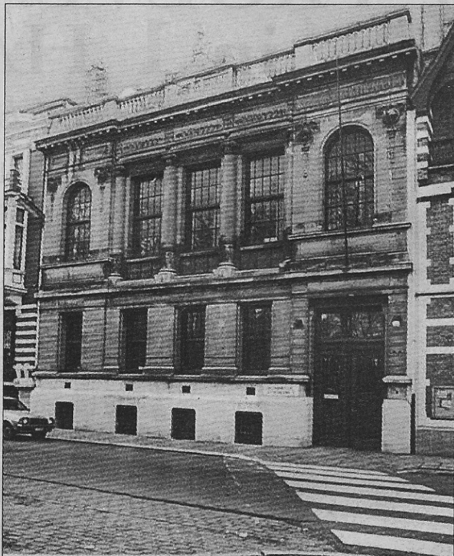
KONINKLIJK ATHENEUM I OOSTENDE 1882 - 1982 100 Jaar Rijksonderwijs

Het Koninklijk Ateneum in de Leon Spilliaertstraat. Het verleden hangt in gangen en zalen.