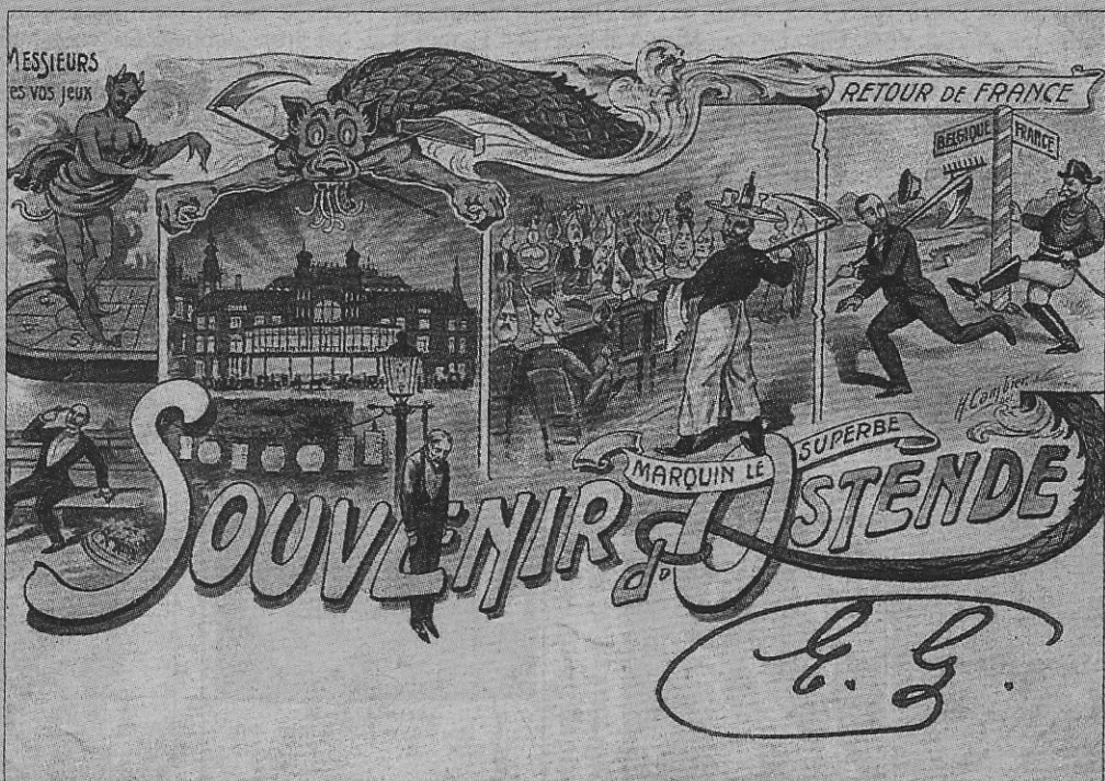
Een moraliserende prent over het casino van Oostende waarop de duivel de spelers lokt om te spelen, met alle nefaste gevolgen vandien (anno 1907).