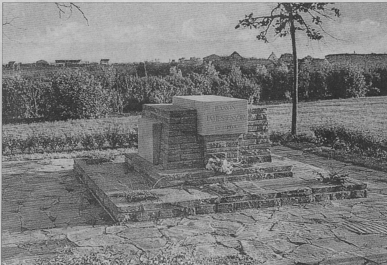
Het graf van James Ensor op het kerkhof aan het Duinenkerkje.

Onlangs bezocht ik het graf van een Engelse vliegenier die in 1917 boven Oostende werd neergeschoten. Bij het terug naar buiten gaan wandelde ik langs een rij gewone grafzerken. Ze vielen niet direkt op.