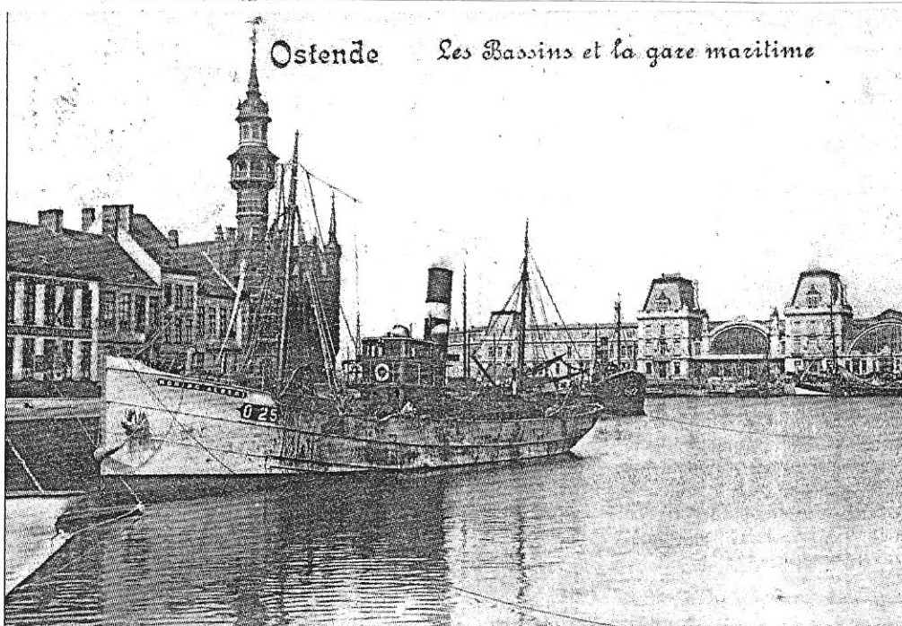
De „Koning Albert” één van de stoere stoomschepen van vòòr 1914 in het 1ste Dok. (Foto a.)