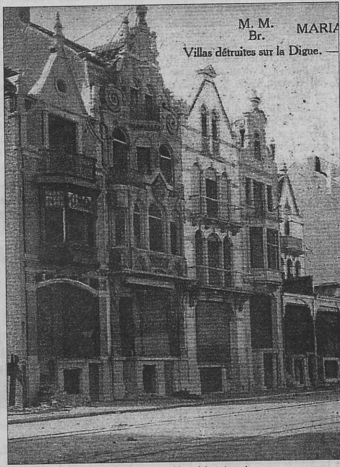
Zwaar beschadigde villa's na Wereldoorlog I