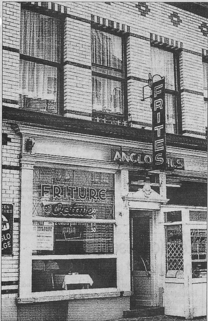
Frituur „Octave”, befaamd uit de jaren 1950-1960