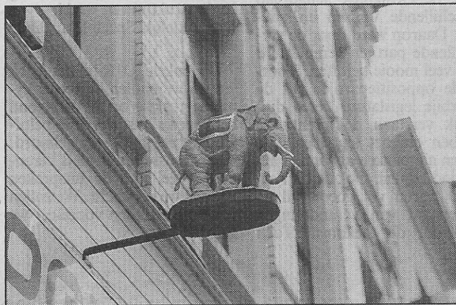
De olifant in de Kerkstraat

Natuurlijk hadden de meeste herbergen een uithangbord met de naam van het drankhuis of van de uitbater. De meest bekende blijft natuurlijk „De drie gapers”, gelegen op