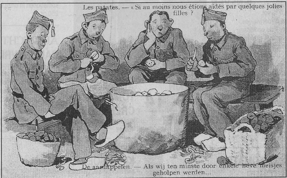
Les patates. — « Si au moins nous étions aidés par quelques jolies filles ? »