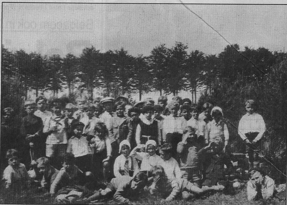
Het tweede studiejaar van de Conscienschool in de bossen van Varsenare in 1934

dat niet genoeg kon gevuld worden : zoveel boterhammen met dit en dat, wat koekjes en chocolade, een banaan en een appel en wat weet ik meer. Ik herinner mij nog de opmerking toen men mij in het eerste jaar zag naar de car komen „Ik geloof dat die voor 14 dagen vertrekt !” Dit eetzakje had een triestige aanblik bij terugkomst. Halfverorberde boterhammen, gesmolten chocolade en een geplette banaan, samengedrukt met enkele geplukte en reeds verwelkte veldbloemen, samen meer het uit-