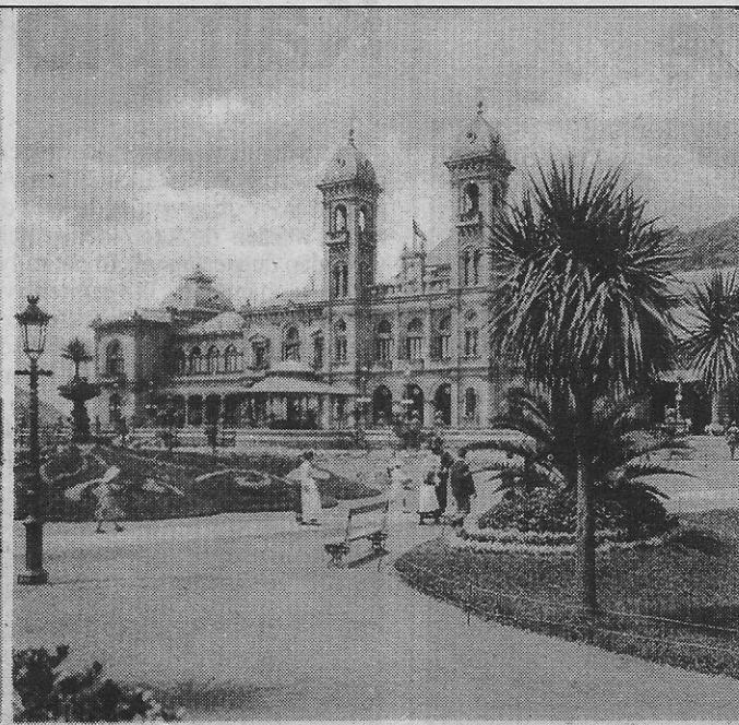
El Gran Casino