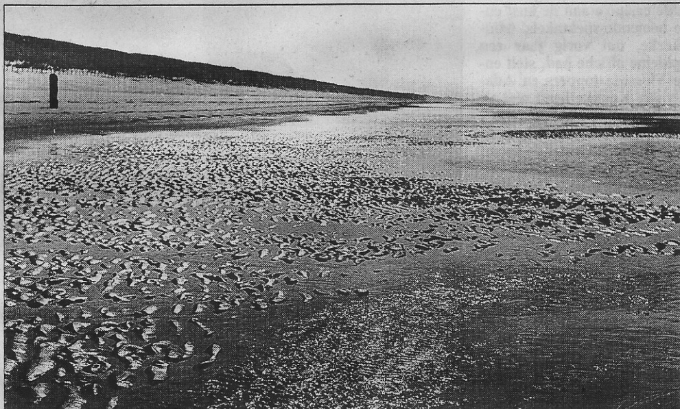
Putten op het strand, bij laag water goed zichtbaar, maar daarom is er nog geen sprake van verraderlijke drijfzandputten bij hoogwater.

Wel is het zo dat het nu rond de golfbrekers erg gevaarlijk is. Maar het gevaar ligt hier in de