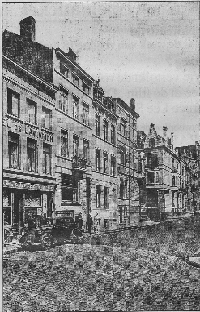
Een zicht op de thans verdwenen kasseien in de Hofstraat. Links ziet men „Hôtel de l'Aviation” (Hofstraat nr 12).

dra zou verkaveld worden. Ook de Hofstraat raakte in die periode meer en meer bebouwd. Er werden verschillende villa's opgetrokken, weliswaar in de vorm van rijkhuizen.