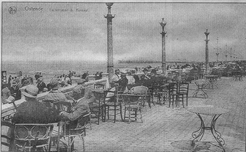
Het open terras (circa 1930)