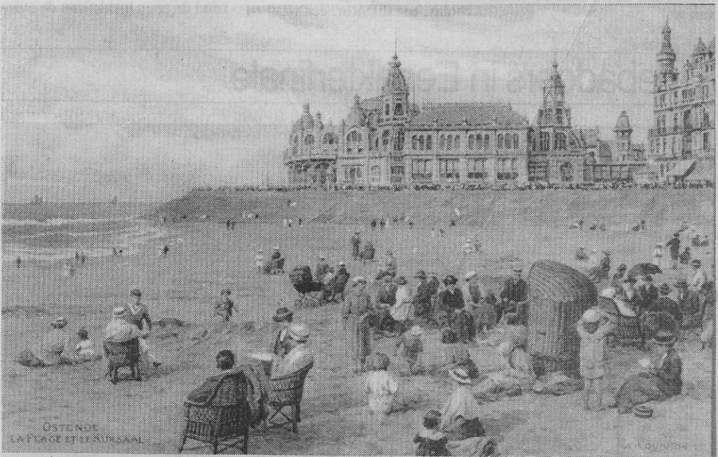
Een typisch strandzicht van voor 1914.