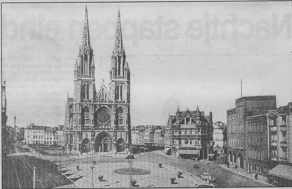
Het St.-Petrus en Paulusplein met rechts het Zeemanshuis (circa 1938)

Het hotel, dat intussen was omgedoopt tot „El Mar”, is al jaren gesloten. De rol van sociaal zeemanshuis was niet verder leef-