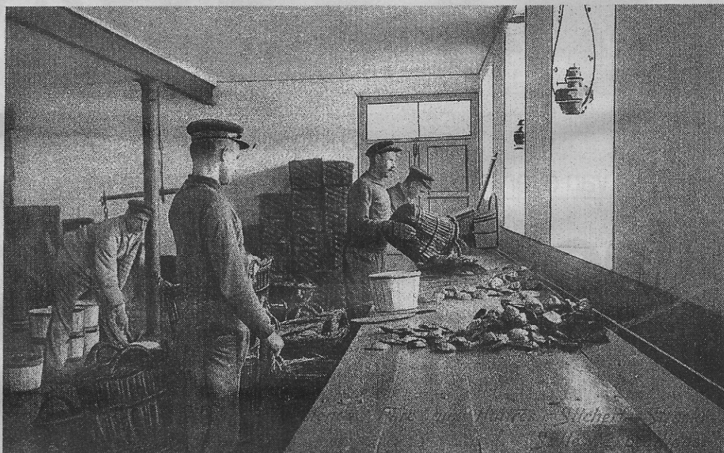
De oesters worden voor verzending gereed gemaakt (circa 1908)

Tegenslag op tegenslag, zoals het overdadig wegspoelen van de jonge larven naar zee (de Spuikom was nog niet voldoende afgesloten). De grote vorst en natuurlijk de oorlog waren er de