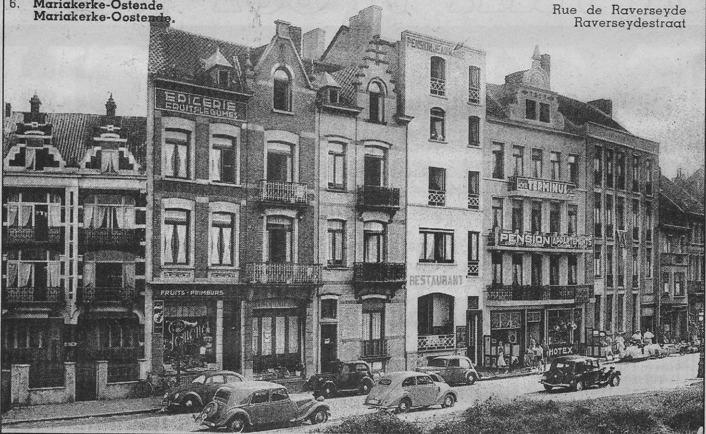
Enkele pensions en de jeugdherberg „De Branding” (het grote gebouw rechts) rond 1950