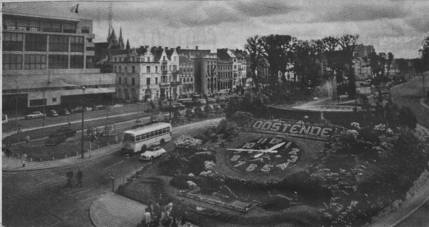
Het bloemenuurwerk ligt met het daarachter gelegen fontein op een verkeerseilandje. In een banderol onderaan kan men lezen „Oostende-Monaco” (1958).

De meest gefotografeerde plaats van Oostende is ongetwijfeld het bloemenuurwerk in het Leopoldpark. Sinds jaren heeft het een bijzondere aantrekkingskracht voor de toerist, want al zijn er in het buitenland hier en daar nog bloemenuurwerken te vinden, toch zijn ze over het algemeen van veel kleiner formaat.