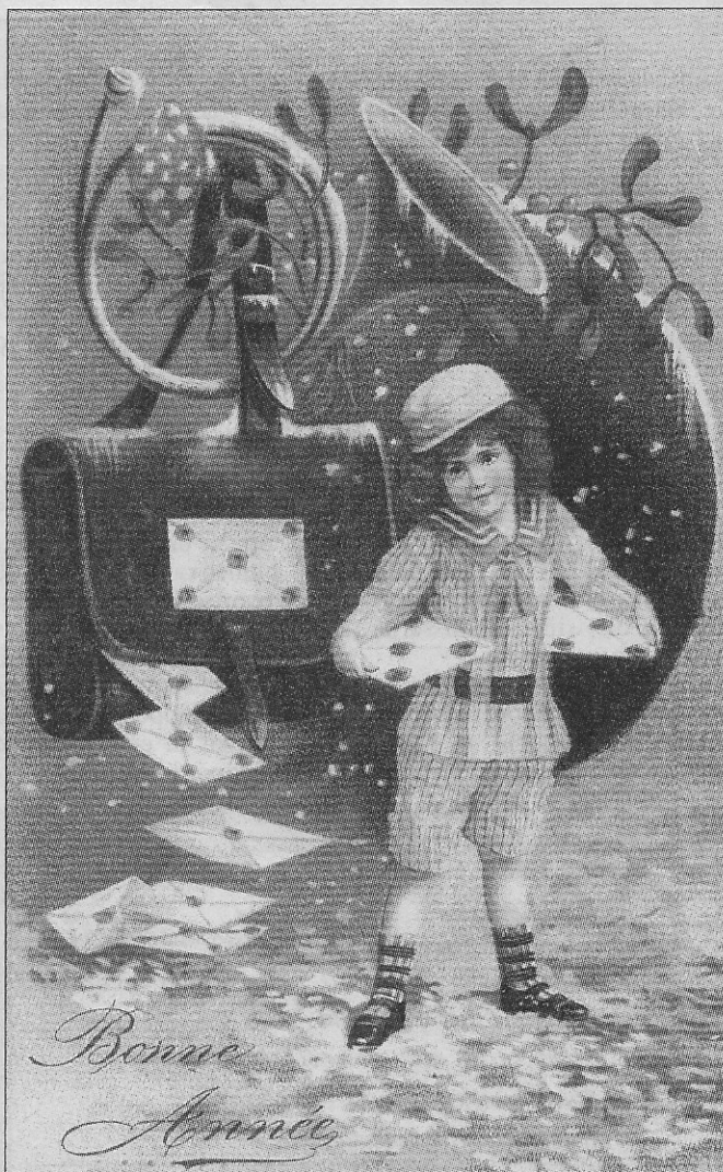
Een kleine postbode onder de maretak, op een wenskaart die omstreeks 1910 in Duitsland werd gedrukt.

Tot onze ontstentenis stelden we vast dat de mistletoe ook in het Leopoldpark begint op te duiken. In enkele bomen aan de E. Beernaertstraat,