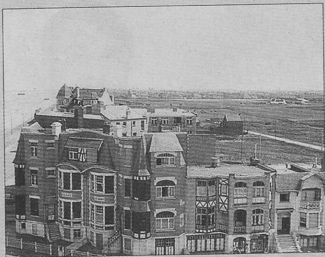
Luchtfoto van Raversijde.