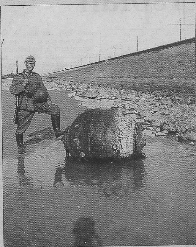
Een Duitse soldaat bij een gestrande zeemijn.