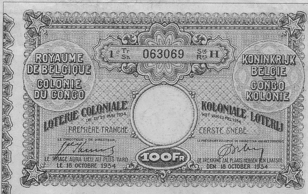
Een loterijbiljet van de eerste trekking die in 1934 plaatsvond.

Tijdens de crisisperiode, kenmerkend voor de jaren dertig, werd bij wet van 29 mei 1934 de Koloniale Loterij in het leven geroepen. Een lot kostte toen al 100 fr., wat heel veel was in die tijd. Er werden dan ook minder loten verkocht dan verwacht. Zowat overal werd publiciteit gevoerd, zelfs op de Wellington Hippodroom.