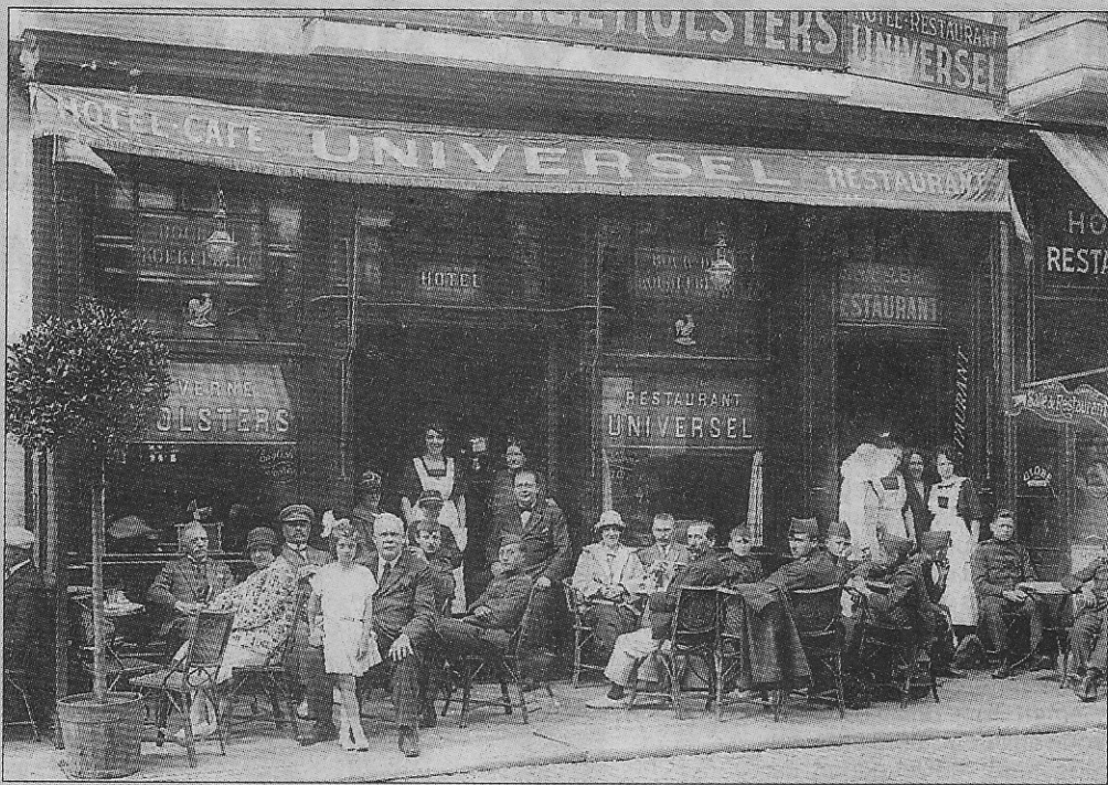
Het typische terras van de Universel in de Adolf Buylstraat rond 1925.

de grote dijkterrassen spreken. Oostende was de stad waar men voor bijna ieder hotel met restaurant een terras zette.