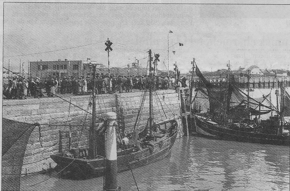
Aan de Trap in Oostende werd er garnalen en 'zootjes' vis verkocht.

Dan heeft het stadsbestuur, vooral om allerlei hygiënische redenen, op dezelfde plaats een garnaalverkoopstand gebouwd. Met dien verstande